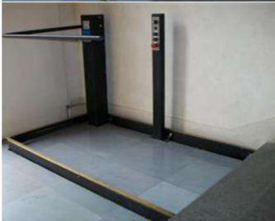
Barre de protection (au repos et en mouvement) et poteau de commande embarqué Autre couleur possible en option