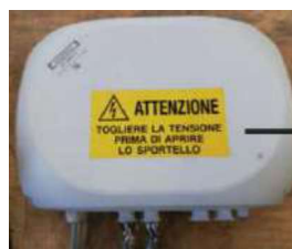
Tableau électrique 500 x 400 x 250mm

Hauteur 950mm x largeur 600mm x profondeur 300mm Située à moins de 7m de l'appareil si possible avec vue sur la plateforme Mise en place de fourreaux aiguillés (diamètre 100mm pour Z-Slim / diamètre 60mm pour X-Slim) Possibilité de retirer l'armoire et fixer les éléments directement sur le mur