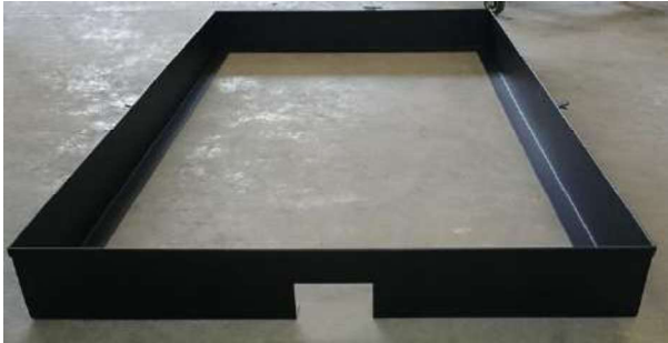
Coffrage d'encastrement (gabarit de pose) Fourni pour la conception de la fosse par le maçon