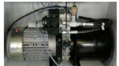
Groupe hydraulique 550 x 270 x 400mm

Tension d'alimentation 220V monophasé ou 220/380V triphasé sur demande Disjoncteur 16A courbe C protégé en amont par 30mA (hors lot)