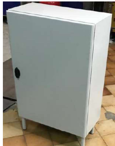
Armoire de commande

Hauteur 950mm x largeur 600mm x profondeur 300mm Située à moins de 7m de l'appareil si possible avec vue sur la plateforme Mise en place de fourreaux aiguillés (diamètre 100mm pour Z-Slim / diamètre 60mm pour X-Slim) Possibilité de retirer l'armoire et fixer les éléments directement sur le mur