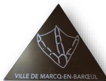
GRAVURE HAPTYGRAPHIQUE SUR FORME TRIANGULAIRE