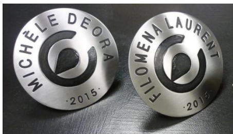
GRAVURE PAR USINAGE