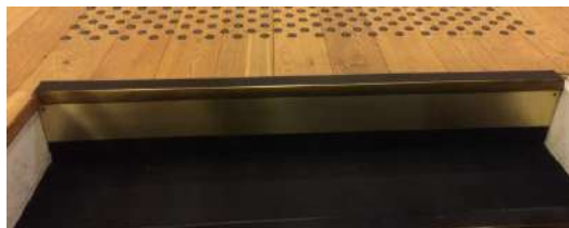
Plaque en laiton

Consultez notre fiche d'information des bonnes pratiques du contraste visuel sur notre site internet www.accesplus.fr