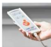
Boîtier de commande pour appeler et renvoyer la plateforme au niveau inférieur