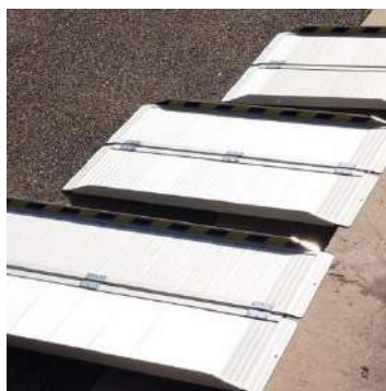
Rampe vendue séparément

La plateforme doit être associée à une rampe d'accès vendue séparément.