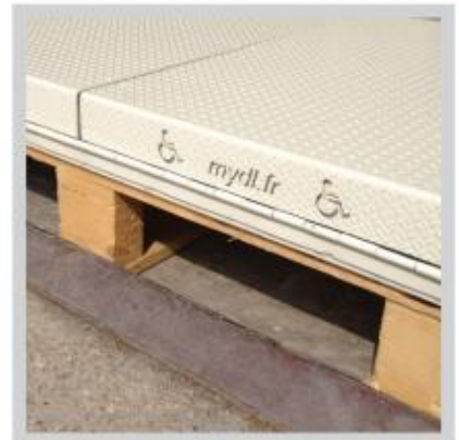
RAL AU CHOIX