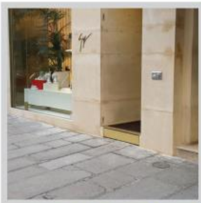
RAMPE TIROIR RECOUVRABLE AVEC FINITION AU CHOIX