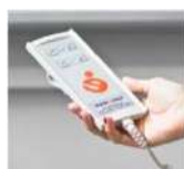
Boîtier de commande pour appeler et renvoyer la plateforme au niveau inférieur